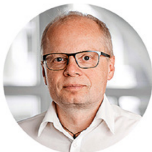
Josef Wagner Juwelier und Optik Präg, Dornbirn